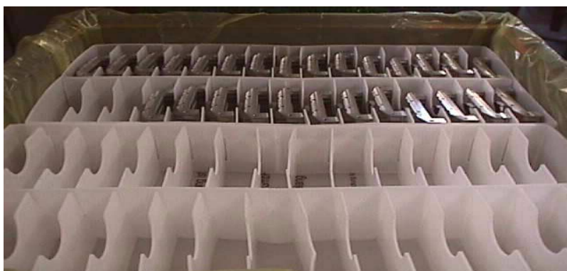
4. Verpacken in Serienverpackung gem. Kundenvorgabe