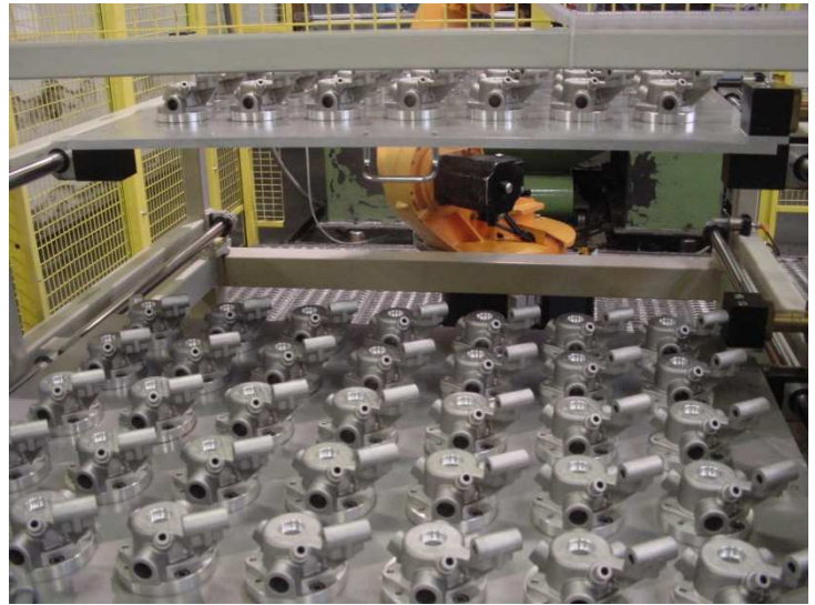
3. Mechanische CNC Bearbeitung