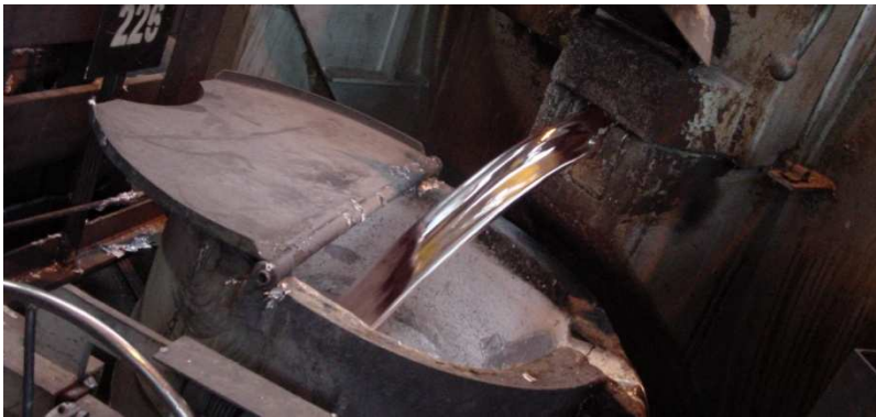
1. Schmelzen von Aluminium