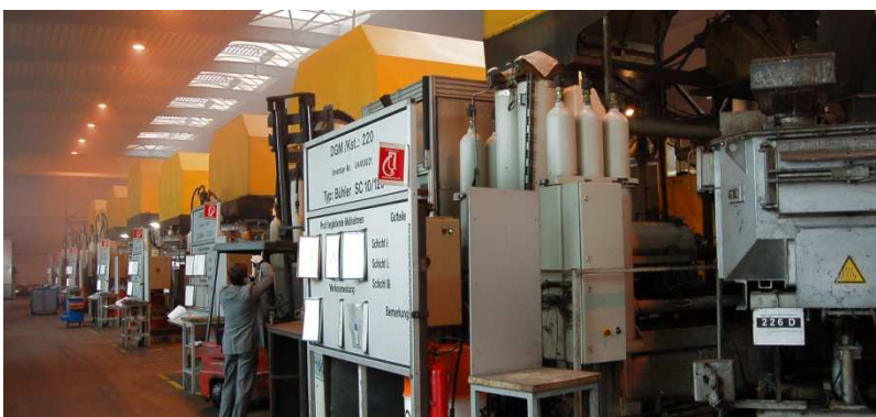
2. Gießen der Rohteile (Sprühen, Gießen, Entnahme und Stanzen)